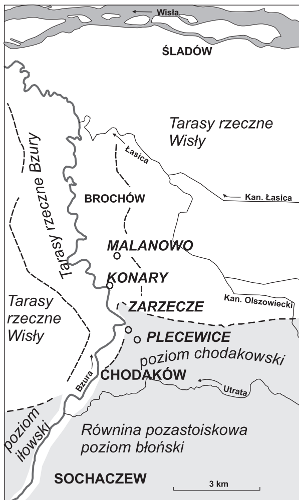
Ryc. 1. Lokalizacja analizowanych profili na tle poziomu chodakowskiego i doliny dolnej Bzury

eoliczne (EM/RM). Najwięcej tego typu ziarn stwierdzono na głębokości 1,5 m. Udział pośrednio obtoczonych ziarn ze środowiska plażowego (EM/EL) dochodzi maksymalnie do niecałych 18%, jednak z reguły jest to 14%. Pozostałe typy ziarn (tj. NU, RM i C) mają do kilku procent udziału w osadzie. Spośród minerałów lekkich dominuje kwarc, którego zawartość waha się w granicach 83–88%. Z kolei maksymalną zawartość skaleni (10–11%) stwierdzono na głębokości 1,2 m. Okruchy skał krystalicznych i rogowce nie przekraczają 3% zawartości. Analiza minerałów ciężkich 1 wykonana dla środkowej części profilu (głębokości 1,0 i 1,2 m) wykazała dominację granatów (54–68%) przy średnio 14% udziału amfiboli. Spośród minerałów bardzo odpornych na niszczenie na uwagę zasługują turmaliny i cyrkonie (odpowiednio 2,8 i 5,2%), a z odpornych najczęściej jest staurolitu na głębokości 1,0 m (7,8%). Brak jest w omawianych osadach nieodpornych minerałów blaszkowych oraz węglanów.